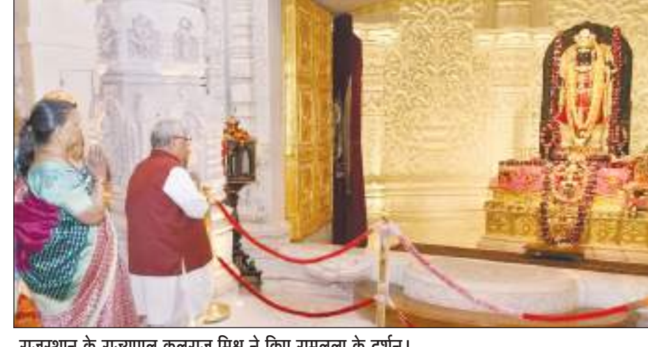
राजस्थान के राज्यपाल कलराज मिश्र ने किए रामलला के दर्शन।

8 शोखावटी यूनिवर्सिटी सीकर और पूर्वांचल यूनिवर्सिटी जौनपुर के बीच खेला जाएगा दूसरा सेमीफाइनल